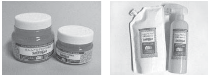
【[スメルゲット]事件で著作物性が肯定された写真】