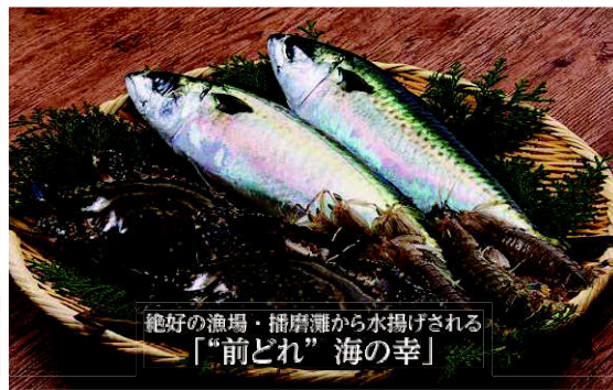
絶好の漁場・播磨灘から水揚げされる 「前どれ」海の幸