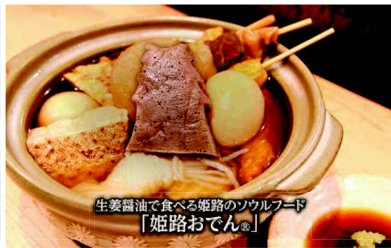
生姜醤油で食べる姫路のソウルフード 「姫路おでん」