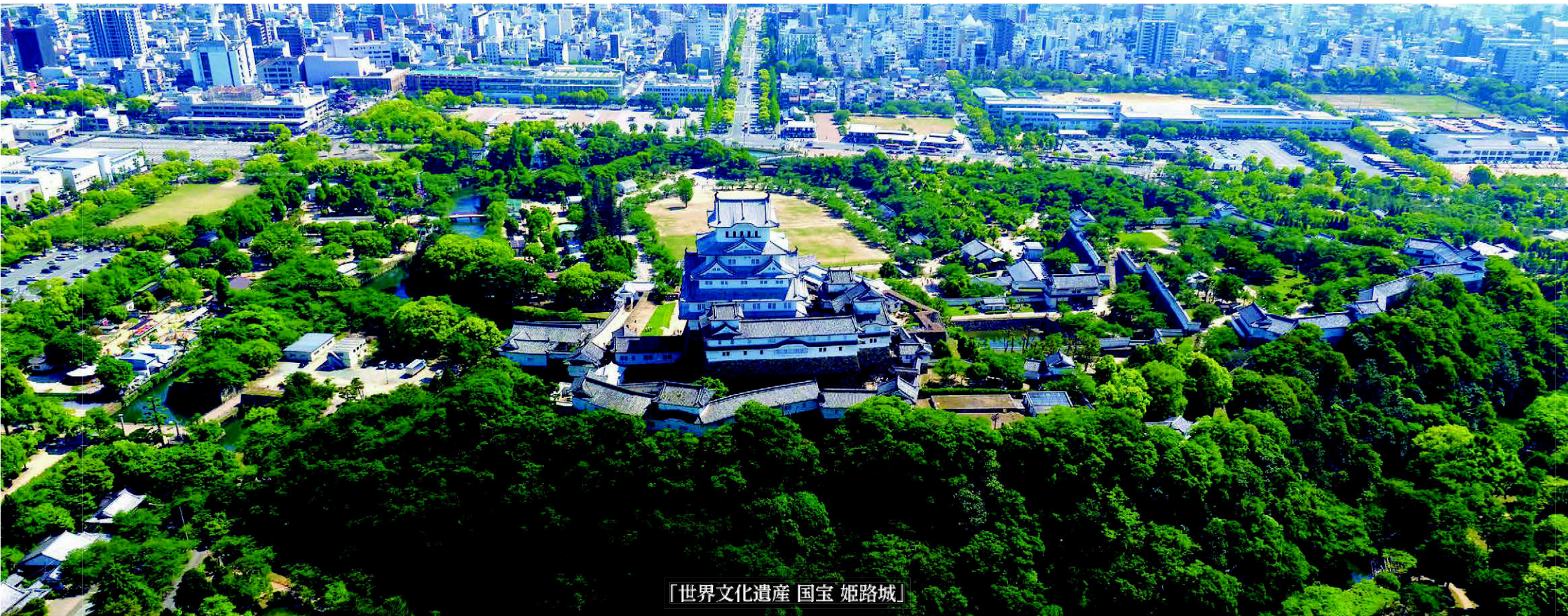
「世界文化遺産 国宝 姫路城」