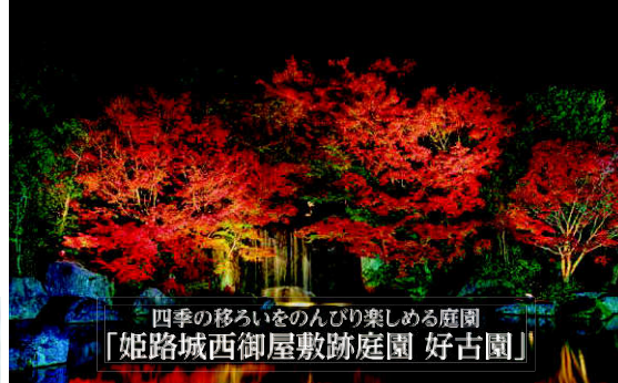
四季の移ろいをのんびり楽しめる庭園 「姫路城西御屋敷跡庭園 好古園」