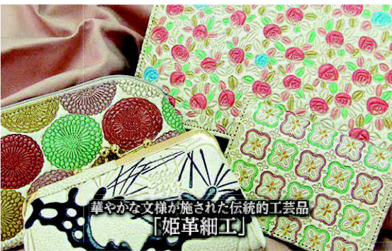
華やかな文様が施された伝統的工芸品 「姫草細工」