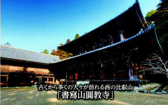
古くから多くの人々が訪れる西の比叡山 「書寫山圓教寺」