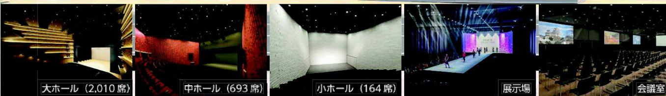
大ホール (2,010 席)