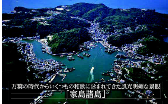
万葉の時代からいくつもの和歌に詠まれてきた風光明媚な景観 「家島諸島」