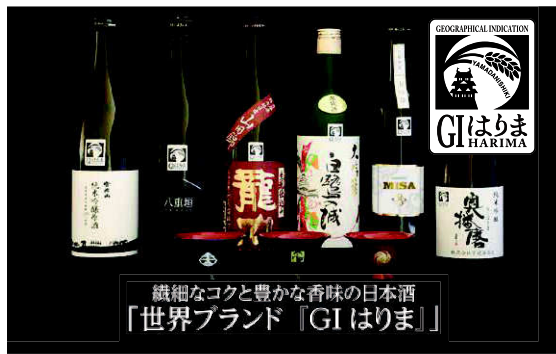
繊細なコクと豊かな香味の日本酒 「世界ブランド『GI はりま』」