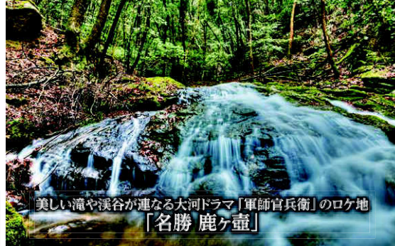
美しい滝や溪谷が連なる大河ドラマ「軍師官兵衛」のロケ地 「名勝 鹿ヶ壺」